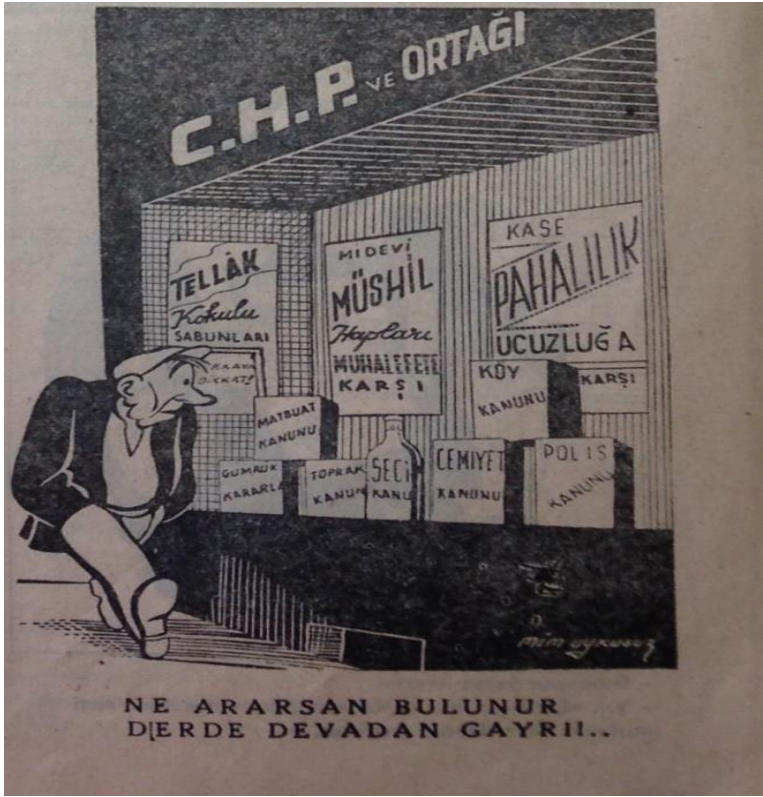
CHP ve Ortağı (12. Sayı, 24 Şubat 1947:1)

Tek partili hayattan, hatta daha gerilerden devralınmış yasal zemin ve bu zeminin iktidar bloğu için sağladığı toplumsal kontrol olanakları, Uykusuz'un nitelemesiyle, CHP'nin " ortak "larıdır: