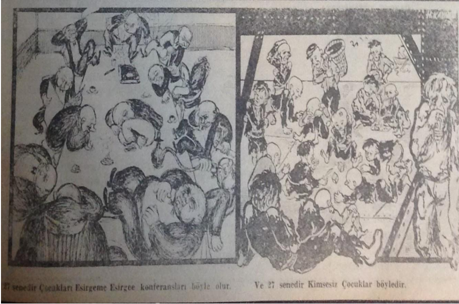
27 Senedir Çocuklar (Medet 6. Sayı, 11 Mayıs 1950:1)

Sonuç olarak, Markopaşa 'nın dönemin varsıllık görüngülerine dair çözümlemeleri, tespitleri, dikkat kesildiği noktalar ve hicvi zenginlik üzerine araştırmalar için tarihsel ve kültürel bakımdan o dönemden yansıyan detaylı olmamakla birlikte ufuk açıcı bir bağlam sunar. Markopaşa , bu bağlam ile o yıllarda varsıllığın kurulduğu güzergahtaki hareketlenmeye dikkat çeker. Koşulları ve kuralları yeniden ve lehte tanımlama çabası gelişmiştir. Bu doğrultuda sürekli üsteleyen, dinamik ve etken bir tavırla ve büyük bir iştahla eylemlilik ve dahası için istek çok belirgindir.