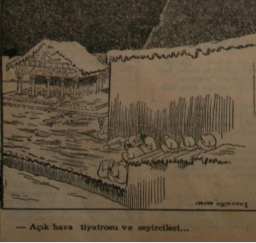
— Açık hava tiyatrosu ve seyircileri...

Açık Hava Tiyatrosu ve Seyircileri (10_35. Sayı, 31 Aralık 1948:4)