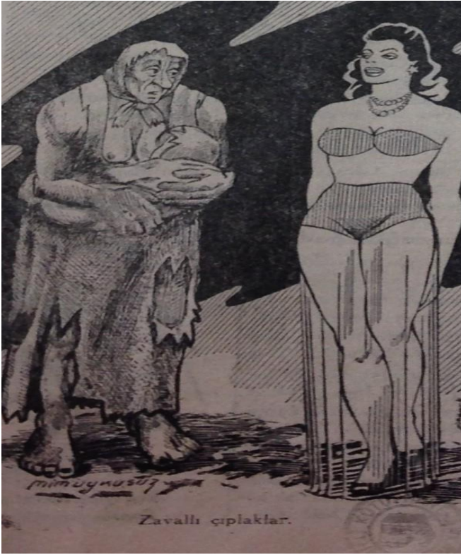
Zavallı Çıplaklar (15. Sayı, 17 Mart 1947:1)

3/10/17/24/31 9 Aralık 1948:2) aile ilişkilerinin “ ığrenç ve sabte ” yanlarını, kadın için “ yuva ”nın masalsi sıcaklığını tenkit eder (“ Markopaşa Dert Dinliyor ”/ 7_35. Sayı, 10 Aralık 1948:4). Kadının güzellik kurgusuyla metalaştırılmasına moda rüzgarıyla kadınların oyuncuğa çevrildiği yorumuyla dikkat çeker (“ Kadın Moda ”/ Yedi-Sekiz Paşa 4. Sayı, 20 Mayıs 1949:3). Kadının işgücü piyasasında deneyimlediği cinsiyete dayalı sömürüyü açığa çıkarır. Cevdet Kudret’in sonradan Sokak adlı eserine giren (1., 2., 3., 4. Sayılar, 25/2/9/16 Aralık 1946:4) “ Hoş geldin Victory ” yazı dizisindeki kinayeli mizansende seks işçilerine yüklenen ‘ milli ’ görev çarpıcı bir sömürü örneğidir. Uykusuz’un “ Zavallı çıplaklar ” karikatürü sömürünün yoksul kadınlara has olmadığı kadının toplumsal konumunda varsıllık belirtileri olarak kurulan imgeler üzerinden de işlediği görülmektedir: