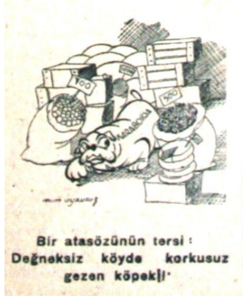
Karaborsa (11. Sayı, 17 Şubat 1947:1; 5. Sayı, 6 Ocak 1947:1)

Kaçakçılar da karaborsacılar kadar doyumsuzdur çünkü "Öyle bir işkembe ki dolmasına imkân yok! Altın kaçırsalar da her gün yüz çuval ile" ("İle"/11. Sayı, 17 Şubat 1947:2). Bu yeni sınıf öbeklerinin rahatlığı ise özgürlüklerin kalın sınırlarla çerçeveslendiği bir dönemde iktidarın temin ettiği geniş hareket alanından gelir. Öyle ki, karaborsacıları koruma ve kalkındırma yolunda gösterdiği ilgiye teşekkür için karaborsacılar eliyle "Başbakana Gönderilen Telgraflar" vardır (17. Sayı, 14 Nisan 1947:3).