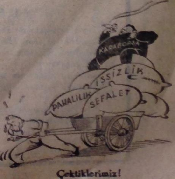
Çektiklerimiz (4. Sayı, 16 Aralık 1946:1)

Ekonomi politiğin varsıllık eksenli yeni dinamiklerine, dönüşen yapısal nirengiler eşlik eder. İkinci Dünya Savaşı'nın ekonomik koşullarında türedi zenginler ve kaçakçılar yeni birikim stratejileriyle serpilme fırsatı bulur. Karaborsa getirdiği tüm külfetle halkın sırtına binmiştir: