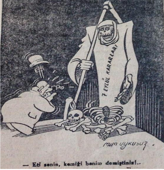
7 Eylül Kararları (9. Sayı, 3 Şubat 1947:1)

Dönüşen ekonomi politiğin bir başka dayanağı 1948 yılındaki iktisat kongresinin, sömürü ağlarını besleyecek cüretkar atmosferidir. Markopaşa "Tencere tava her biri bir hava" manşetiyle aktardığı iktisat kongresinden notlarında "milli" kavramının tılsımıyla meşrulaştırılmış iktisadi model hayalini aktarır (6_35. Sayı, 3 Aralık 1948:1, 3). Bin iki yüz otuz delegenin ülke ekonomisinin milli sorunlarına çözüm önerileri; var olan topu topu birkaç yüz milyonerden vergi alınmaması, vergilerin zaten "açlığa, susuzluğa, çıplaklığa" alışmış on sekiz milyona yansıtılması, milyonerleri himaye kurumunun kurulması, karaborsanın serbestleştirilmesi, serbest meslek erbabının "milli kaçakçılık" yapmasına müsaade edilmesi ve devletçilikle özel teşebbüs arasındaki hudutların netleştirilmesi yönündedir. Varsılların yükünün halka yıkılması ve varsıllara meşru ya da gayrimeşru, yasal ya da yasa dışı her türlü kolaylığın sağlanması için olanaklar değerlendirilir.