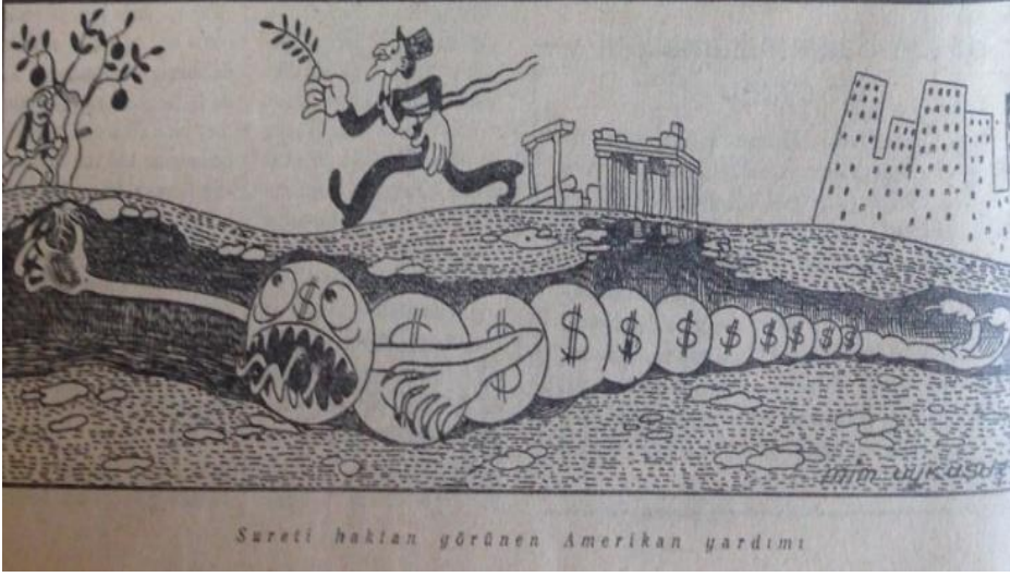
Amerikan Yardımı (Malûmpaşa 4. Sayı, 29 Eylül 1947:4)

Buna karşılık, varsılların tek umursadığı, özgün tüketim alışkanlıkları, tercihler ve imtiyaz sembolleri ile toplumsal ilişkilerde üst kat konumlarını pekiştirmektir. "Üst kat"ın ilişki ağları Karpıç Lokantası, Tokatlıyan Otel ve Park Otel gibi mekanlarda cereyan eder. "Artık yeter!" şiirinde (2. Sayı, 15 Eylül 1947:2) sınıfsal sömürü ilişkilerini siyasal ve kültürel bağlarıyla çözümlerken Malûmpaşa "Tokatlıyan, Karpıç, palaslar aman/ Bizde Balıkpazarında meybane yeter" der. Benzer şekilde lüks tüketim büyük itibar kaynağıdır. "Altına Hücum" (13. Sayı, 3 Mart 1947:4) adlı kurmaca bir filmdeki lüks ve şatafat, kürkler içinde genç ve güzel kadınlar, cümbüş, göz kamaştırıcı gerdanlar, iştah açıcı baldırlar ve milyonlarca aç arasındaki tezat karşısında Amerikalı gangsterler dahi dehşetler içinde bayılabilmektedir. Olası istenmeyen itirazlara karşı meşruiyet kaynağı da geliştirilmiştir: hayırseverlik. Örneğin, Çocuk Esirgeme Kurumu çatısında "endami bozulmaması için hiç çocuk doğurmamış Anneler Birliği" tarafından Park Otel'de bir "Gece Eğlencesi" (15_36. Sayı, 8 Şubat 1949:4) tertip edilir. "Yoksul çocuklar şerefine" kadeh kaldırılacak gecede tuvaletlerin altından çamaşır izlerinin belli olmaması esaslı gündem maddelerindedir. Arada eğlence gecesine sebep çocuklar için uzun uzun "ab" çekilir. Böyle hayır gecelerinden Uykusuz'un kalemine yansıyan bir kesit çocukların gerçeğinin hayırseverlerin dünyasına pek ulaşmadığını gösterir: