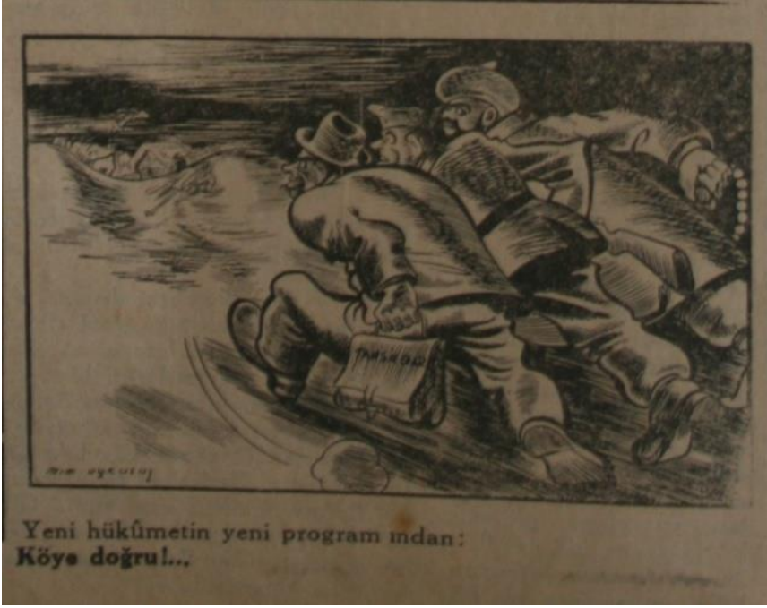
Köye Doğru (15_36. Sayı, 8 Şubat 1949:2)

Nuh'un artık iskelete dönmüş tarihi ineği " kulakları köylünün, kıyıruğu tahsildarın elinde " çeğiştirilecek, en nihayetinde bu hayvandan bile bir pay alınacaktır (" Nuhun İneği Bulundu "/ Öküç Mehmet Paşa 1. Sayı, 6 Ekim 1949:1, 3). Köylü, vergi borcunu ödedikten sonra devletin de takdiriyle feodal iktidar ağlarıyla baş başadır." Cavit Oralın Nutku !" ( Yedi-Sekiz Paşa 3. Sayı, 13 Mayıs 1949:1) karnı aç köylülerin ocaklarına incir ağacı dikileceğini çünkü " Patagonyadan binbir zorlukla " getirtilen tahta tekerlekli, bakır direksiyonlu, odun borulu muazzam dev traktörlerin köy ağalarına teslim edileceğini haber eder. Bu arada, 1924 tarihli ve 442 sayılı Köy Kanunu'nun köylü için getirdiği mecburi ve isteğe bağlı vazifeler kapsamında, kadın ve erkek, bütün köylü imece usulü ile kendi sosyal politikalarını ve hizmetlerini kendi imkanlarıyla geliştirdiğinden Markopaşa 'nın iktidara çarpıcı önerileri vardır (" Fırsat bu fırsat "/8. Sayı, 27 Ocak 1947:4). Köylü, köyünü imar ederken kazandığı inşaat meziyetleri ile şehirdeki belediyeye ve bayındırlığa yardım için kaldırımları ve apartmanları yapmaya yardımcı olabilir.