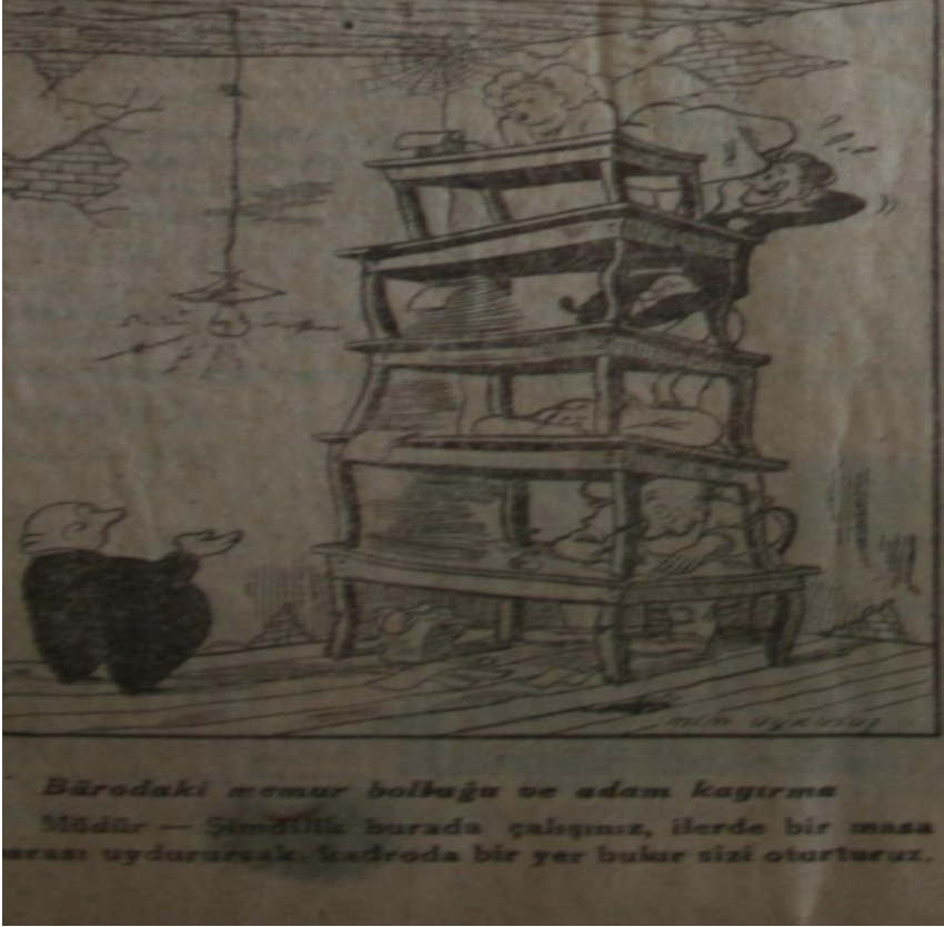
Büroda Memur Bolluğu (Yedi-Sekiz Paşa 1. Sayı, 29 Nisan 1949:1)

çalışmak için dahi yüksek mertebelerden tanıdıklar, iktidarın vesayeti altında yer tutma gibi bireyi indirgeyen ve bireyin özgüveni üzerinde ağır tahribat yaratabilecek niteliklere bakılmaktadır. Çalışma koşullarında ise liyakatsizlik, kayırmacılık ve atıllık esastır: